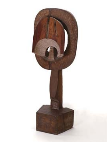
【MASKVI】1967年 神奈川県立近代美術館蔵