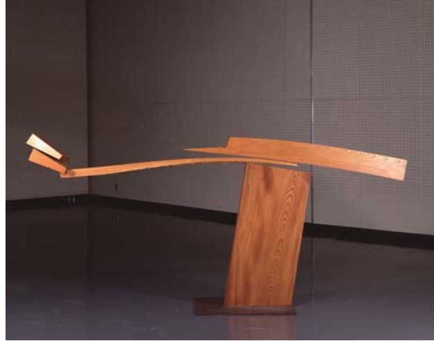
【そりのあるかたち】1980年 埼玉県立近代美術館蔵