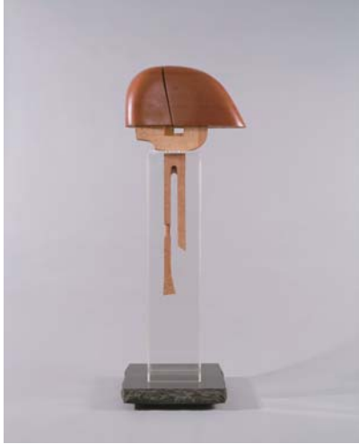
【木時計】1975年 東京都現代美術館蔵

本展では昨年の文化勲章受章を記念し、ライフワークとなっている代表作「そりのあるかたち」シリーズをはじめとする彫刻や環境造形作品を紹介します。今なお多彩な活躍をみせる澄川喜一の作品を通して、清瀬ゆかりの芸術文化に親しむ機会となれば幸いです。