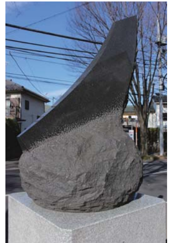
【そりのあるかたち '90】1990年 キヨセ ケヤキロードギャラリー